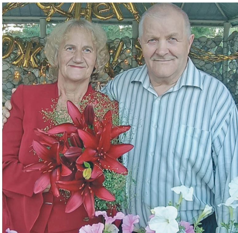
спромхозе «Уоянский», затем до выхода на пенсию - ремонтником ИССО РЖД. За свой многолетний добросовестный труд семейная